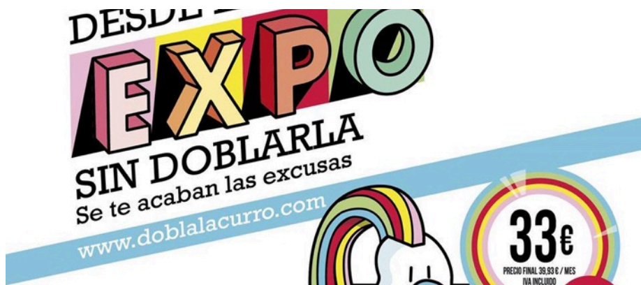
Cartel promocional de los centros Galisport con la imagen de la mascota Curro un poco abandonada físicamente