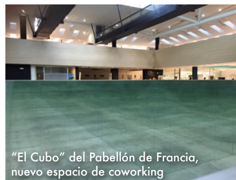
“El Cubo” del Pabellón de Francia, nuevo espacio de coworking

Las “oficinas” se ubican alrededor del conocido “Pozo de las Imágenes” que construyeron los franceses y que, en su conjunto, ha sido rebautizado como “El Cubo”, conservando los espejos de sus paredes.